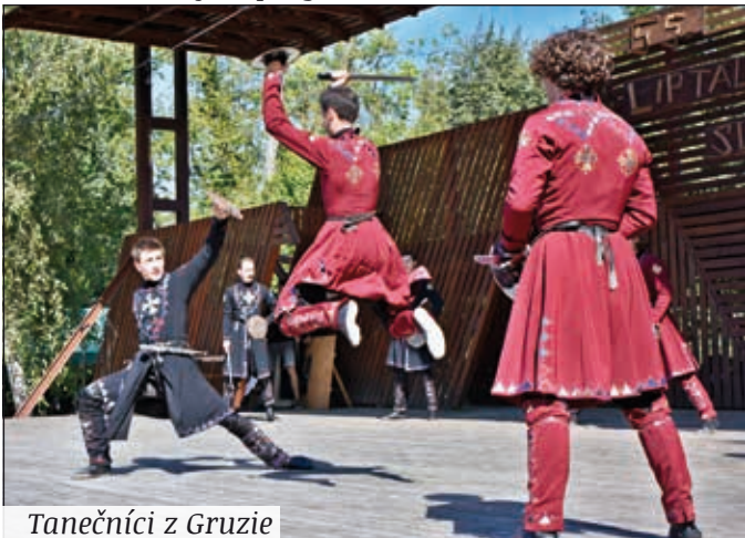
Tanečníci z Gruzie