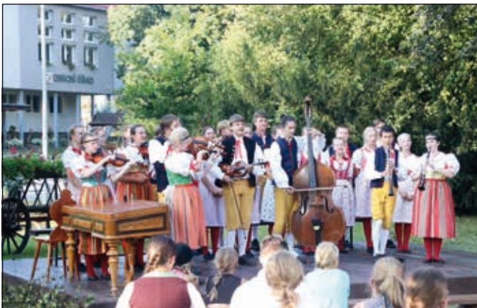
Muzicírování, Mladinka Plzeň