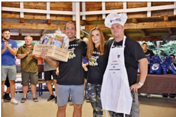
1. místo porota