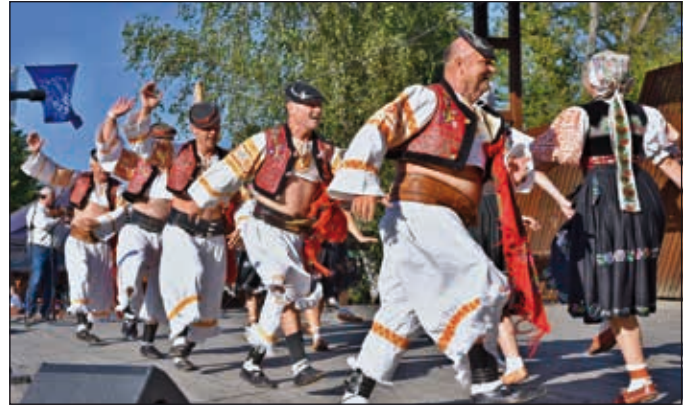
Slovensko - Očovan