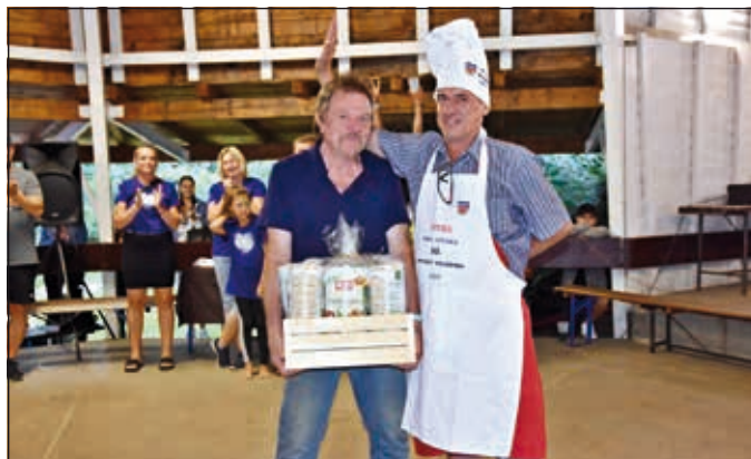
1. místo lid

Pořadatelé v rámci dne mysleli i na ty nejmenší návštěvníky. Pro ně byly přichystány zábavné atrakce či jízda na koních a koňských povozech. Naopak starší generace ocenila vystoupení dechové kapely Liptalanka. K večeru poté hudební doprovod obstarala skupina 1+1. Po celou dobu akce byla otevřená i zámecká kavárna, kde v rámci akce ve večerních hodinách proběhla profi ohnivá a žonglérská show. Nakonec Program pomalinku ukončoval nádherný ohňostroj.