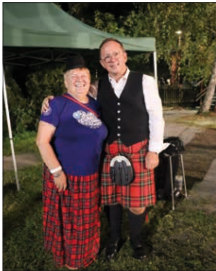
Skot a Jana