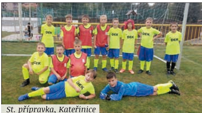
St. přípravka, Kateřinice