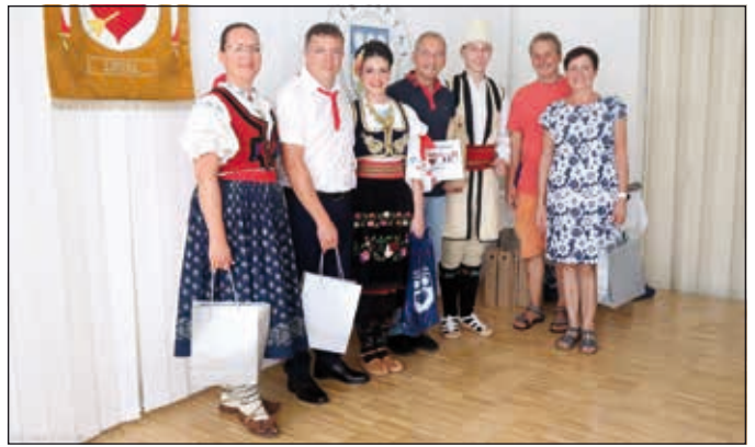
U starosty, Srbsko