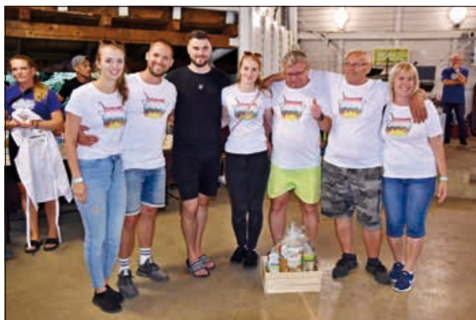
3. místo lid