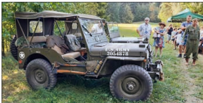
Dobová technika - Jeepy

Synonymem pro tuto bitvu je bezesporu čtyřmotorový dálkový bombardér Boeing B-17G Flying Fortress (Létající pevnost). Ten patřil ve své době k hlavním pilířům amerického bombardovacího letectva nad evropským bojištěm, stal se synonymem těžkého bombardéru druhé světové války a na nebi s ním nebylo pro protivníka příjemné setkání. S propracovanou strategií ochrany proti stíhačům a svou mohutnou výzbrojí 13 těžkých kulometů ráže 12,7mm ve střeleckých věžích a trupu se dokázal účinně bránit. Jeden z těchto strojů ze stavu 49. perutě 2. bombardovací skupiny Boeing B-17 G, S/N 44-6369 dopadl po opakovaných útocích německých stíhačů na zem u Liptálu v místech zvaných Vartovňa (přesněji řečeno vybuchl již ve vzduchu). V průběhu letu se propadl ze své formace až k čelu 20. perutě, kde ho zastihl útok německých stíhaček. Všem letcům z „liptálského“ stroje se jako jednomu z mála podařilo útok přežít, po výskoku na