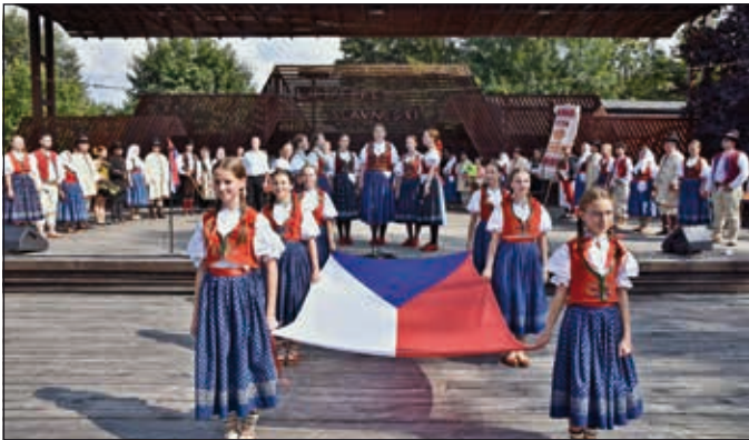
Neděle, zahájení programu