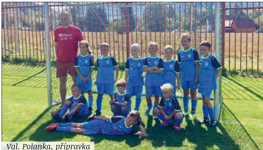
Val. Polanka, přípravka