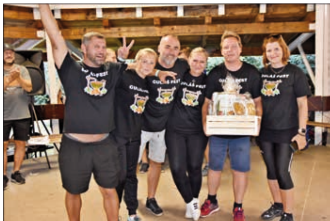
2. místo lid