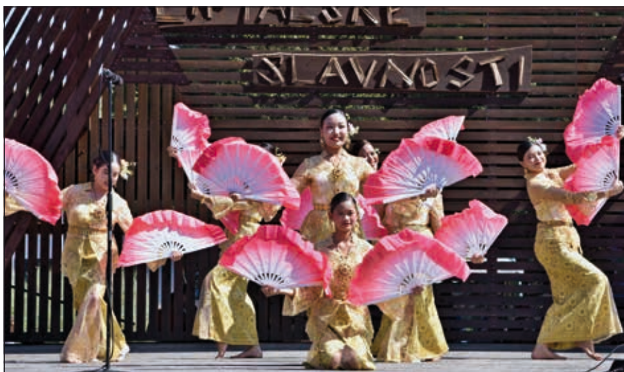
Tanečnice z Thajska

Z domácích souborů vystoupili Mužský sbor z Kudlovic, DFS Mladinka z Plzně, DNS Brněnský Valášek, Sedmikvítek z Frenštátu