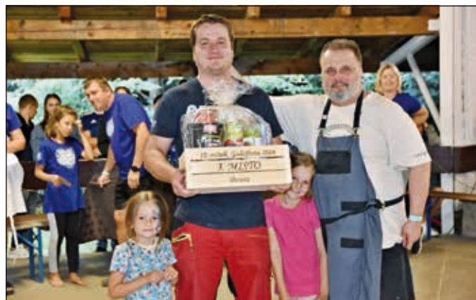
3. místo porota