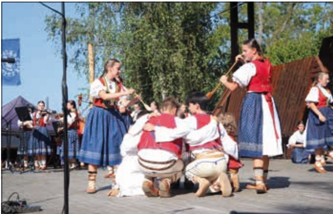
Malá Lipta, Trnka