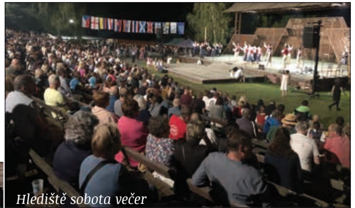
Hlediště sobota večer