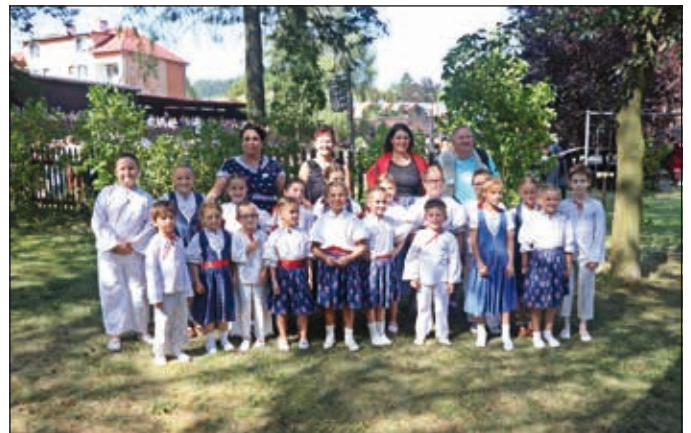
Malušata a Malí ogaři