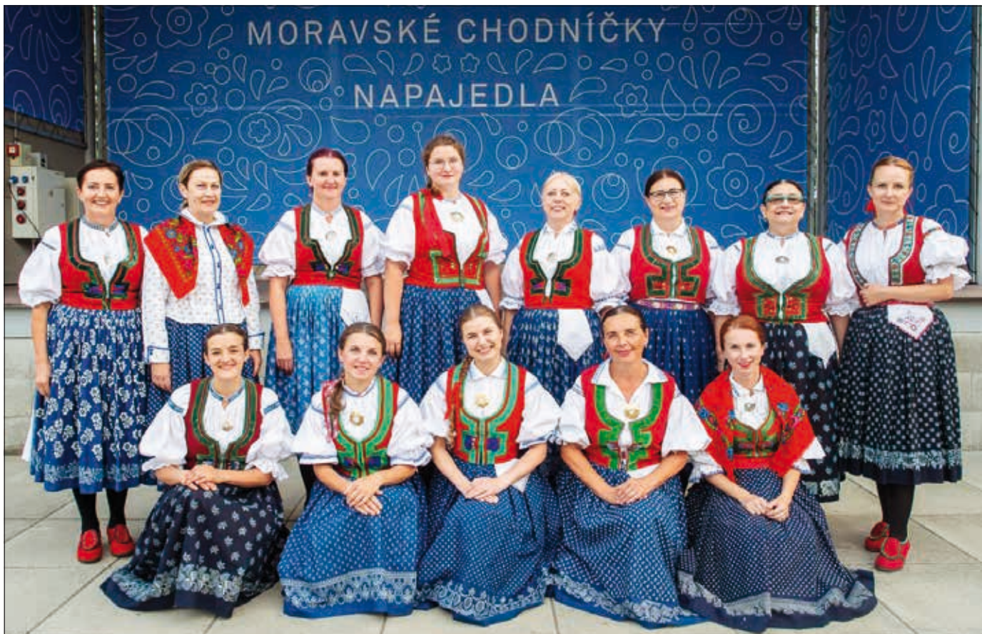
Festival Moravské chodníčky, Napajedla, 2024