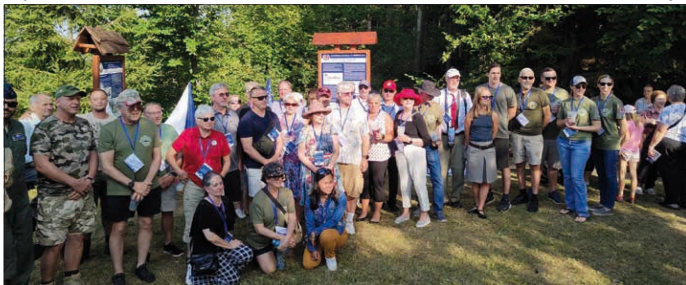
Hosté z USA