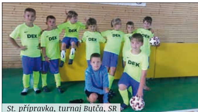
St. přípravka, turnaj Bytča, SR