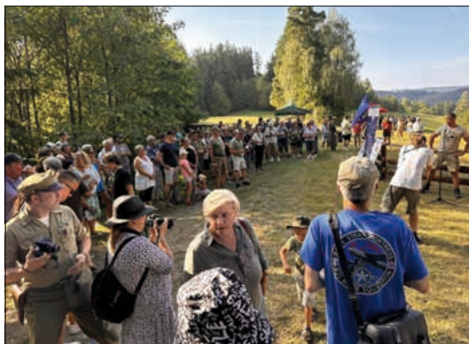
Zahájení vzpomínkové akce

padácích byli zajati a dočkali se konce války v německých zajateckých táborech.