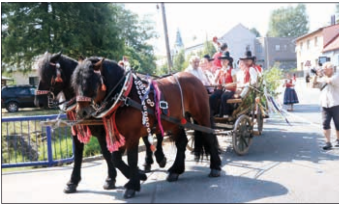
Průvod, Baronkovy koně