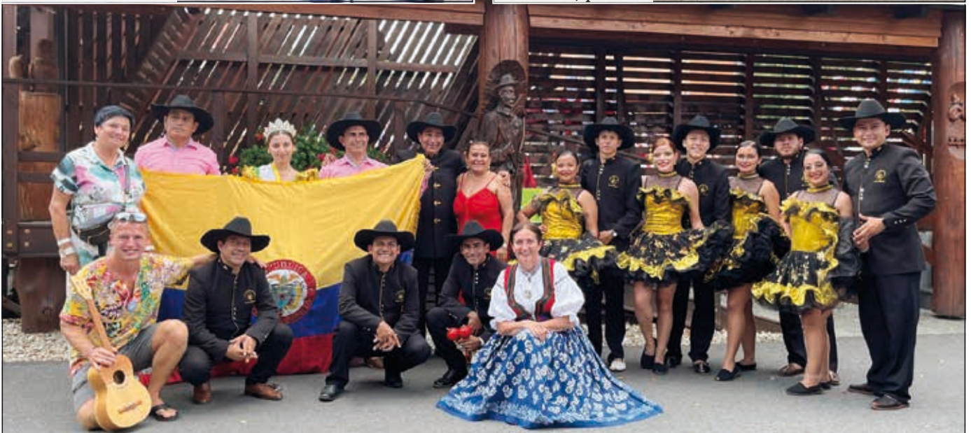
Kolumbie za podiem