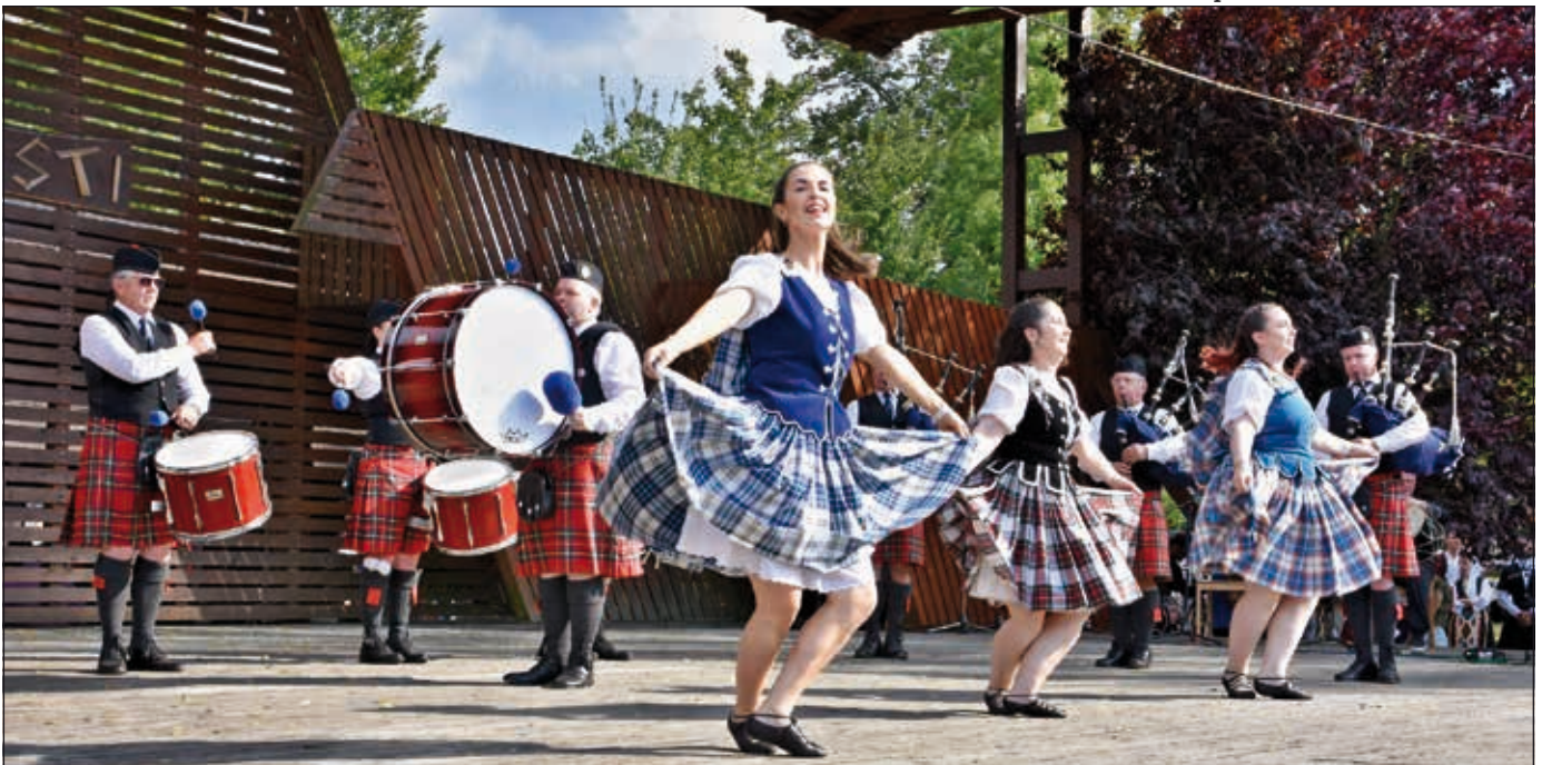
Skotští dudáci a highlander dancers