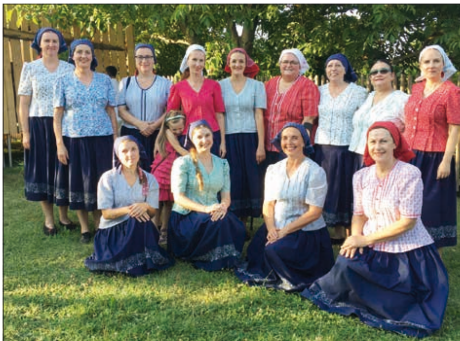
Festival Kudlovice, 2024

šly poprvé a od té doby se traduje vznik pěveckého sboru Rokytenka. Jeho název je odvozen od potoka Rokytenka, který teče z Liptála na Vsetín – právě z tohoto údolí je většina zpěvaček.