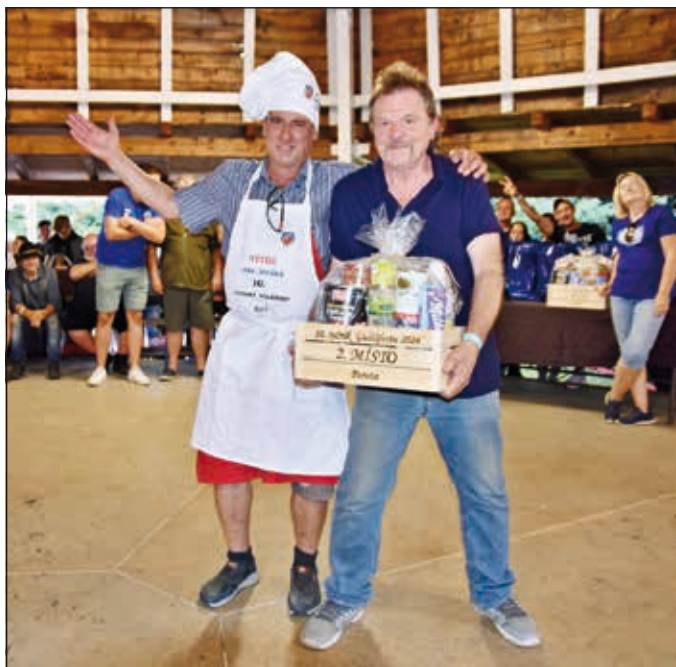
2. místo porota