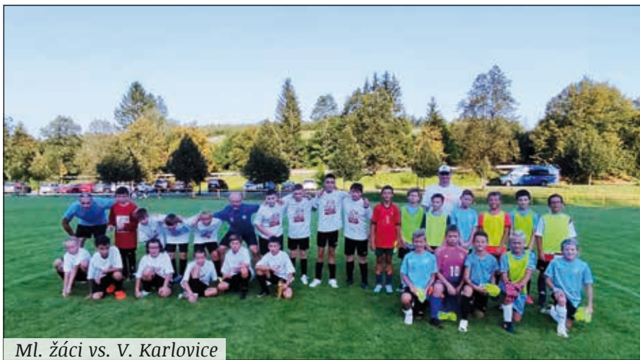
Ml. žáci vs. V. Karlovice