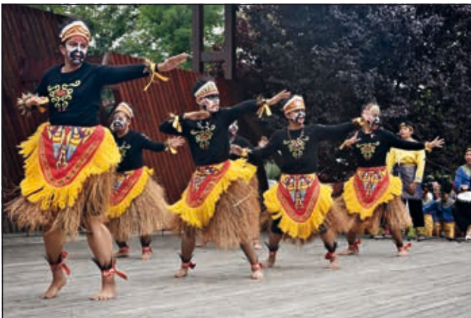
Indonesie - tanec džungle