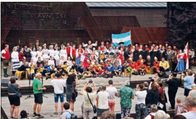
Neděle závěr galaprogramu