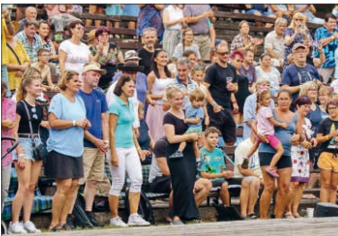
Diváci v Liptále v neděli