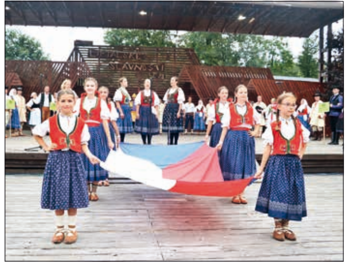
Hymna, neděle galaprogram