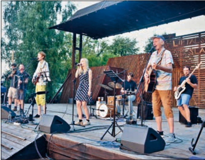
Skupina Goralé-Pocta Čechomoru