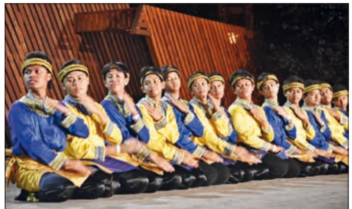
Indonéský tanec tisíce rukou - Saman