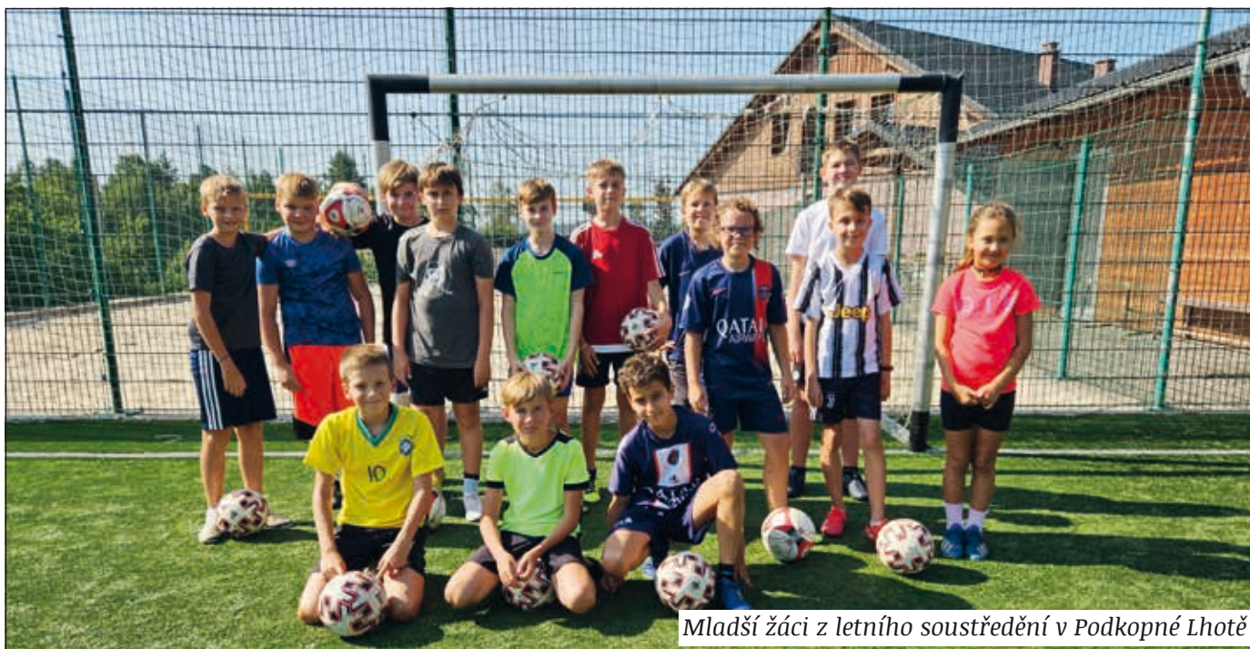
Mladší žáci z letního soustředění v Podkopné Lhotě