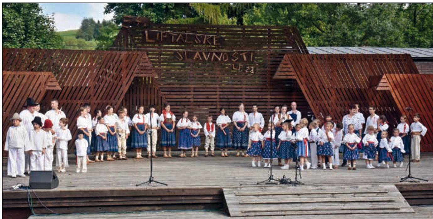
Malí Ogaři, Mala Lipta, Malušata