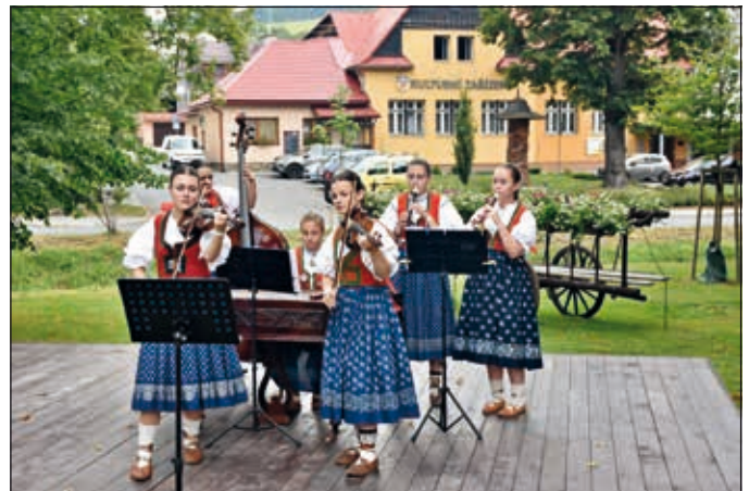
CM Cérky v zámeckém parku