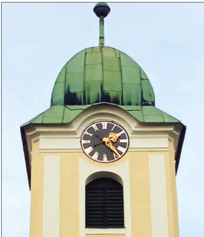
Výměna oken a nové věžní hodiny

Na konci léta jsme s otcem Jindřichem připravili rozlučku dětí s prázdninami. Akce byla zahájena mší svatou, která byla obětována za děti, které půjdou