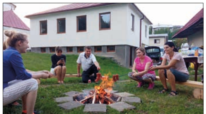
Dětská mše a táborák