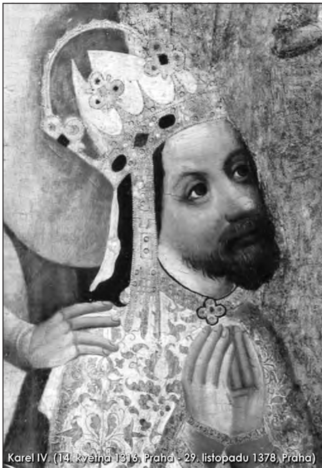
Karel IV. (14. května 1316, Praha - 29. listopadu 1378, Praha)