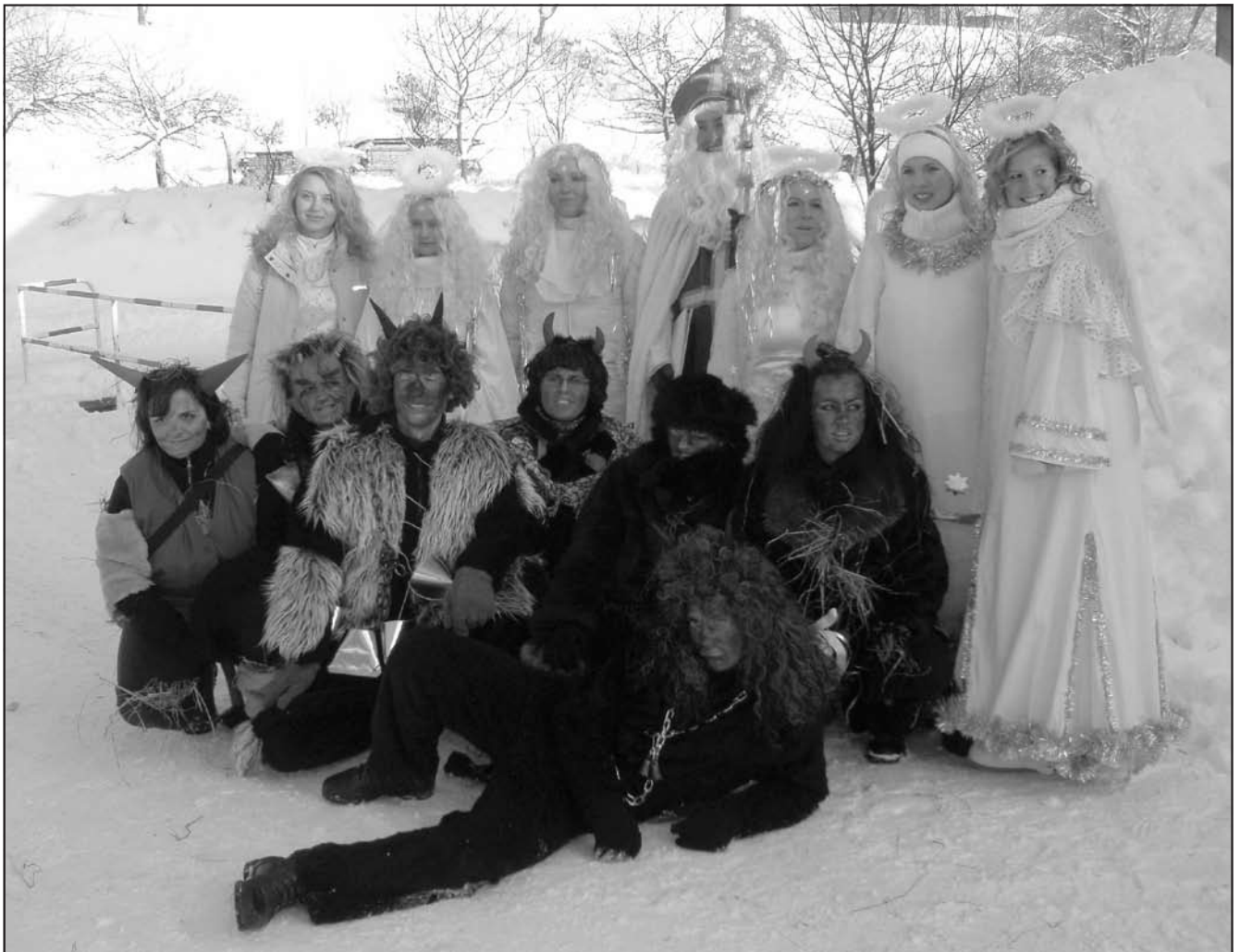
Mikulášská družina 04. 12. 2010