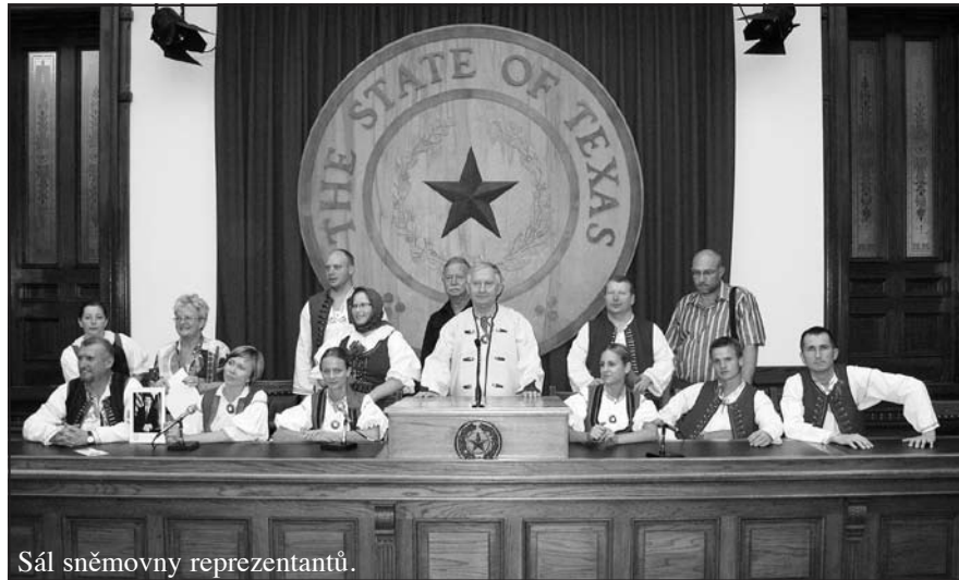
Sál sněmovny reprezentantů.

V 9:00 h jsme všichni odjeli na bohoslužby do kostela ve Fayetteville. Měli