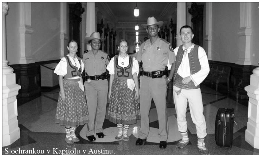
S ochrankou v Kapitulu v Austinu.

znamená „Bůh žehnej Americe“. Tento nápis mne velmi zaujal, a tak jsem přemýšlel, co je k tomu vedlo. Určitě je to národní hrdost, velká úcta ke své zemi, ale i k Bohu. Také jsem přemýšlel, zda by u nás našel někdo odvahu dát si na auto nápis „Bůh žehnej České republice“ a co by na to říkali ostatní. Snad se toho jednou dočkáme.