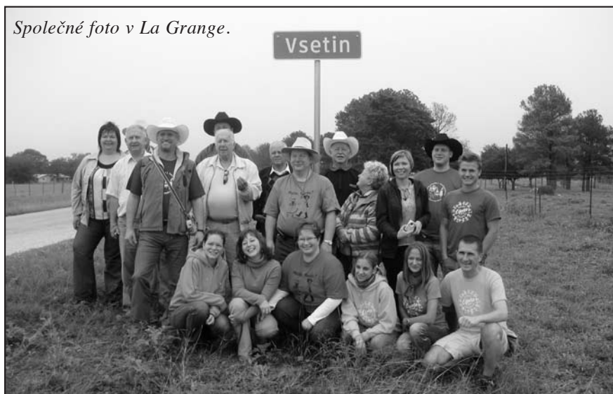
Společné foto v La Grange.

s radostí ke zpěvu přidávali. Rozvlněné valašské sukně roztleskávaly přítomné a umocňovaly tento hluboký zážitek, jenž mnohdy vhněl i slzy do očí.