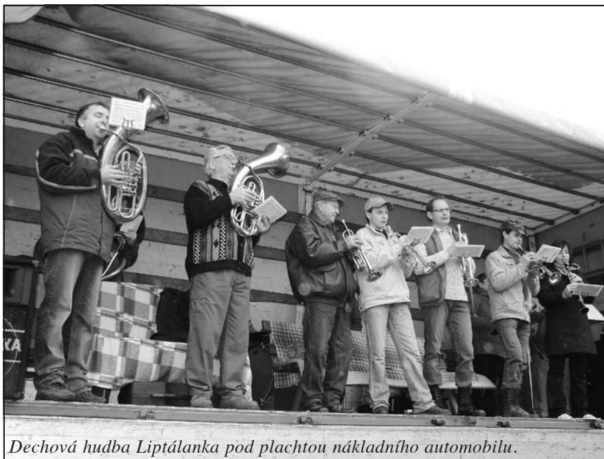
Dechová hudba Liptálanka pod plachtou nákladního automobilu.

tek roku na Vartovně spolu s občany okolních obcí a turistickou veřejností. Setkání připravujeme na 2. ledna 2010 v 11:00 hodin na Vartovně a u této příležitosti jsme oslovili bratry faráře v Liptále, Jasenné a Leskovci s žádostí o požehnání této stavbě.