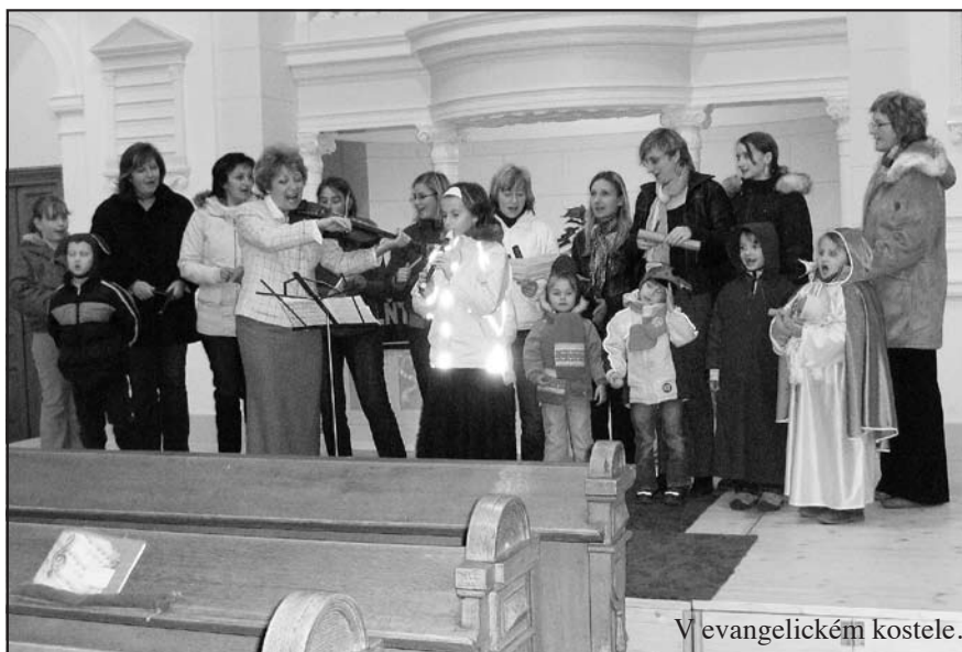
V evangelickém kostele.

Spolu s dětmi jsme na zahradě za budovou školky plánovali vysázení bludiště z keřů, ale nakonec jsme