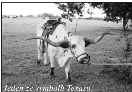
Jeden ze symbolů Texasu.

Poté následovala prohlídka reprezentačních prostor senátního sálu (31 senátorů) a sálu sněmovny reprezentantů (150 poslanců). Po obědě v obchodním centru poblíž Austinu se vracíme zpět do hlavního města, kde máme vystoupení pro skupinu Čechů. Zajímavé bylo převlékání do krojů. U nás jsme zvyklí se převlékat kdekoliv, kde je to jen trochu možné, třeba i společně muži i ženy. V Americe však jde o velký problém, na veřejnosti je to skoro nemožné, a tak jsme se převlékali např. na toaletách, aby nás nikdo neviděl. Po vystoupení bohatá večeře. Každá rodina donesla z domu nějaké jídlo, zákusky, koláčky a tak bylo z čeho vybírat. Poté byla opět družná zábava, dokonce udělali mezi sebou sbírku, jejíž výtěžek nám poté slavnostně předali.