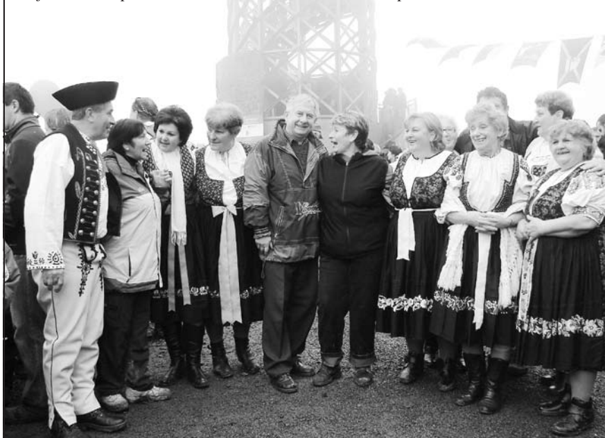
Krojovaná skupina z Dohňan se starostou obce Liptál.