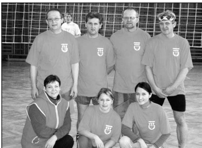
Turnaj Liptál 2003.