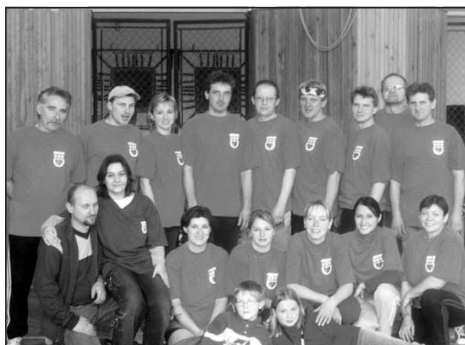
Tak jsme tenkrát začínali a na dresech nešetřili.