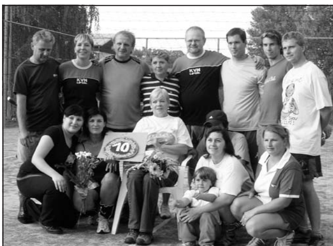
Společné foto, 10. výročí založení klubu.