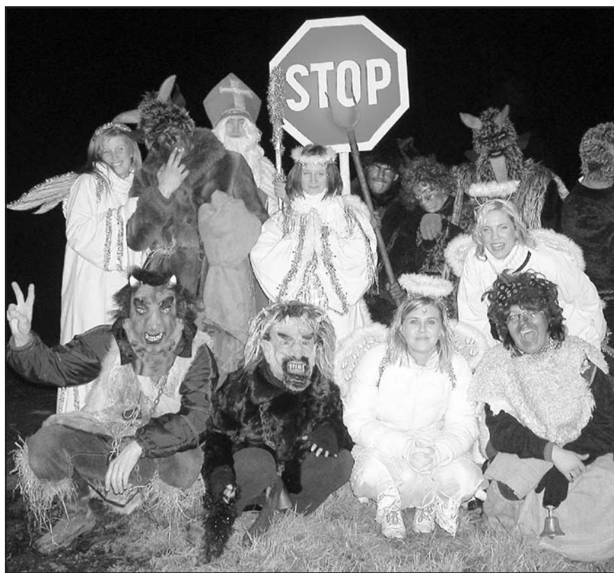
Foto je z 9. Mikulášské jízdy 2008.