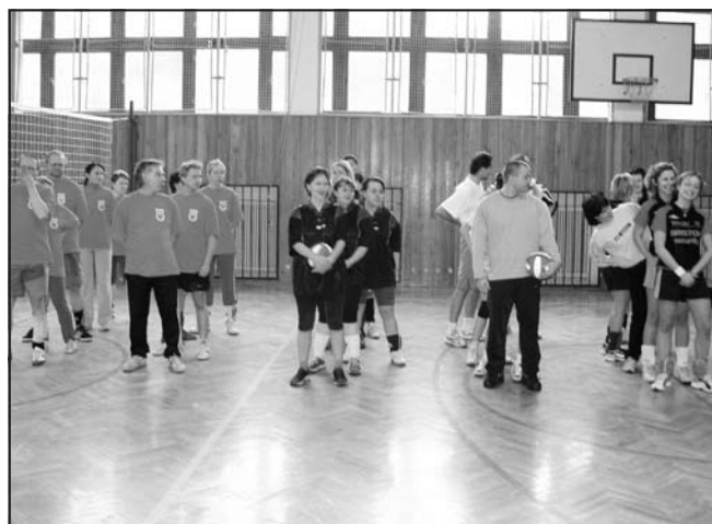
Turnaj smíšených družstev Liptál 2003.