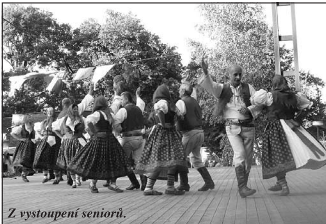
Z vystoupení seniorů.

Centrem celosvětového folkloru se opět po roce stala obec Liptál. Proběhl tady devětatřicátý ročník mezinárodního festivalu lidové hudby a tance Liptálské slavnosti. Do zdejšího amfiteátru se přišly během tří dnů podívat tisíce lidí, na pódiu se jim předvedly desítky souborů. Mediálním partnerem akce byl týdeník Jalovec.