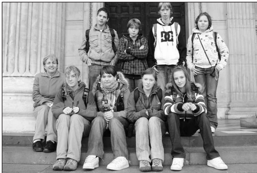
Před katedrálou sv. Pavla.

Na trajekt jsme dorazili pozdě v noci, jelikož moře bylo neklidné a trajekt se houpal, nebylo některým zrovna do zpě-