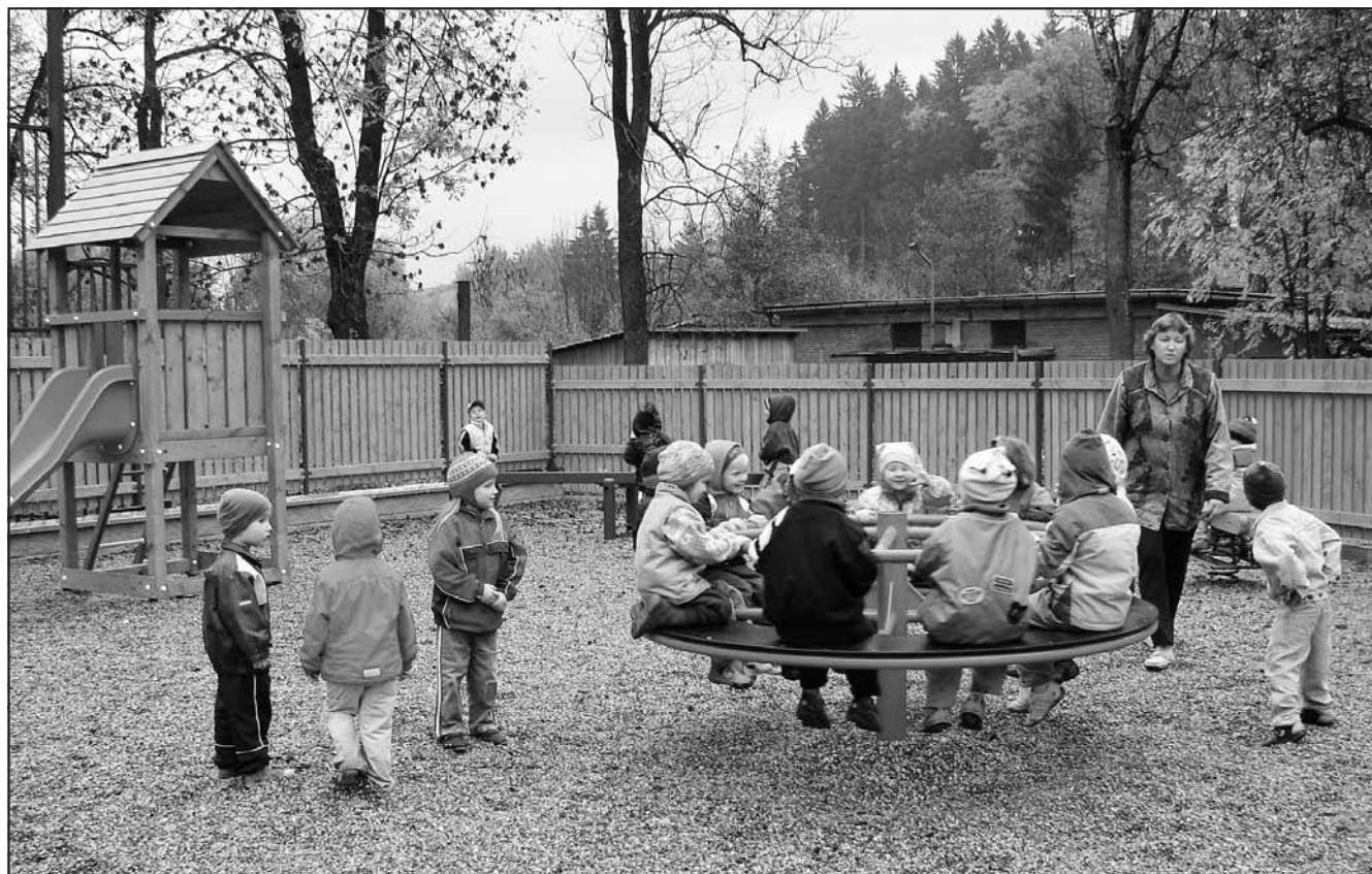
Nové hřiště si hned vyzkoušely děti z mateřské školky.