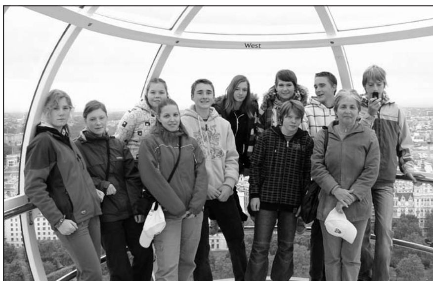
Všichni v kabině Londýnského oka.

vu, ale všichni ve zdraví přežili a už jsme se přes Francii, Belgie a Německo dopravili zpět do České republiky. Většinu cesty jsem spala, takže si ani příjezd do rodné vlasti nepamatuji. Postupně nás opouštěli naši „účastníci zájezdu“, nás ale čekala ještě cesta vlakem na vse-