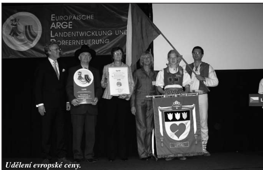
Udělení evropské ceny.

Celkové vítězství si odnesla italská obec Sand in Taufers z jižního Tyrolska. S udělenými cenami není spojena žádná finanční odměna.