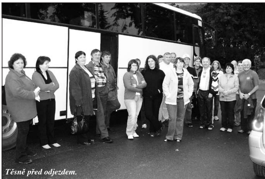
Těsně před odjezdem.

nastoupit na plochu stadionu /nakonec šla jen část/ nebo tvořit jen diváky po obvodu. Navíc se hodně ochladilo, foukal ledový vítr a většina na to nebyla připravena. Tak jsme všichni „mrzli“ a sledovali úžasné vystoupení dechových orchestrů, kdy asi sto muzikantů oblečených v dobových unifor-