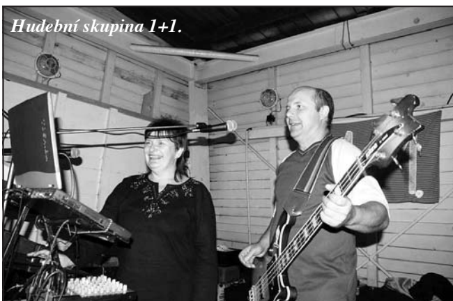
Hudební skupina 1+1.

Liptálské slavnosti organizuje místní obecní úřad ve spolupráci se Zlínským krajem, souborem Lipta a republikovým folklorním sdružením. Tradiční přehlídka folkloru požívá ve světě velké prestiže, o čemž svědčí i zájem zahraničních hostů, kteří se tady rok co rok střídají. Na slavnosti pravidelně přijíždějí i soubory z velmi exotických států. Letos to měli na Valašsko nejdál potomci kanibalů z Nového Zélandu. Kromě nich se představili i tanečníci a tanečnice z Turecka,