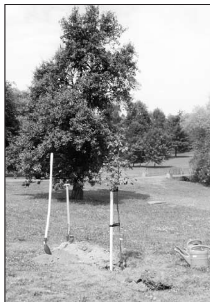
Památná hrušeň na Pietním území v Lidicích a švestka věnovaná dětem z Liptálu 21.6.2007