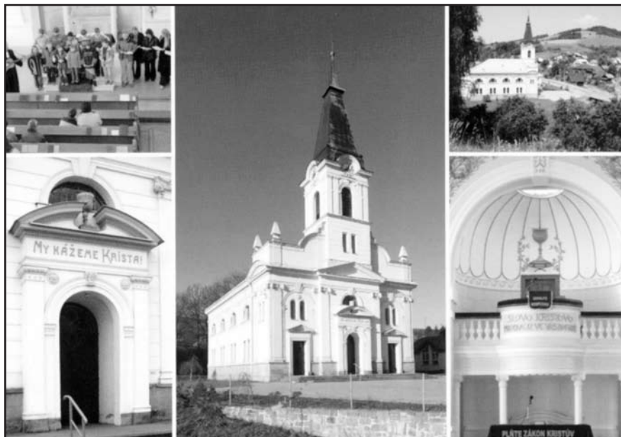
Pohlednice ke stému výročí.