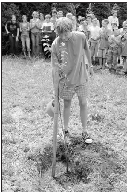
Sázení švestky v Základní škole Liptál 21. června 2007