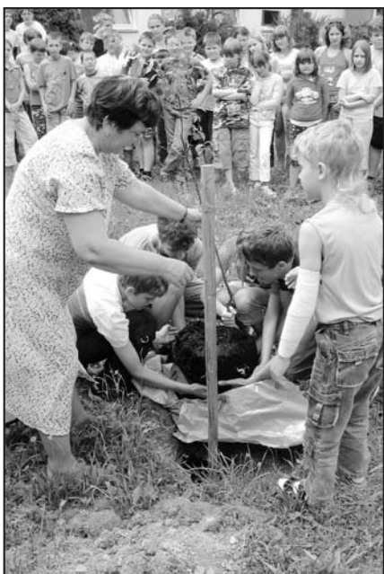
21. června 2007 sázení švestky v Základní škole Liptál.