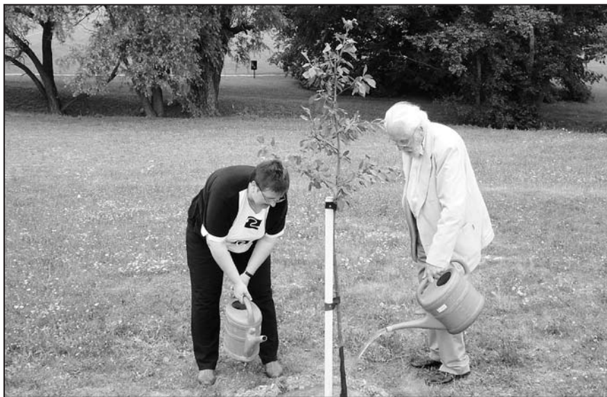
Sázení Švestky pro Lidice 21.června 2007.