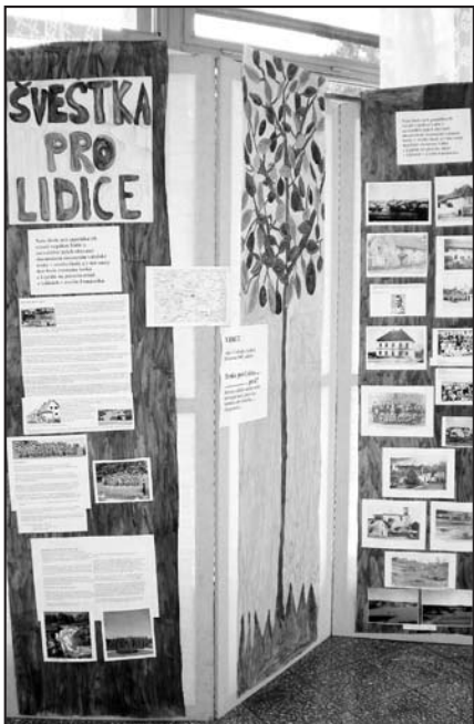
Informační panel o Lidicích.