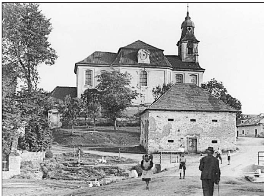
Fotografie z Lidic z léta roku 1941. V levém rohu je vidět obecní studna a nad ní je vidět kůl, u kterého roste mladá hrušeň.....za rok zde nebude nic, jen zlomená hrušeň, která se jako zázrakem vzpamatuje a poroste dál...