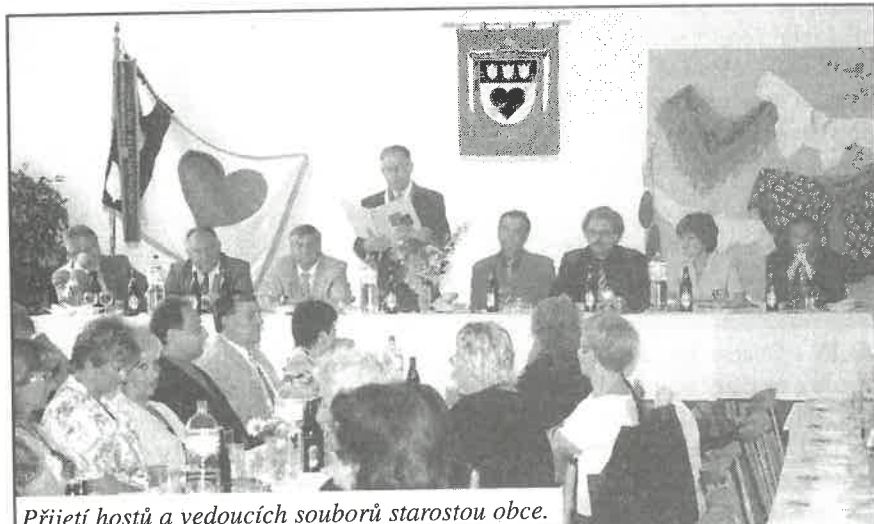
Přijetí hostů a vedoucích souborů starostou obce.