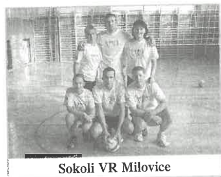
Sokoli VR Milovice