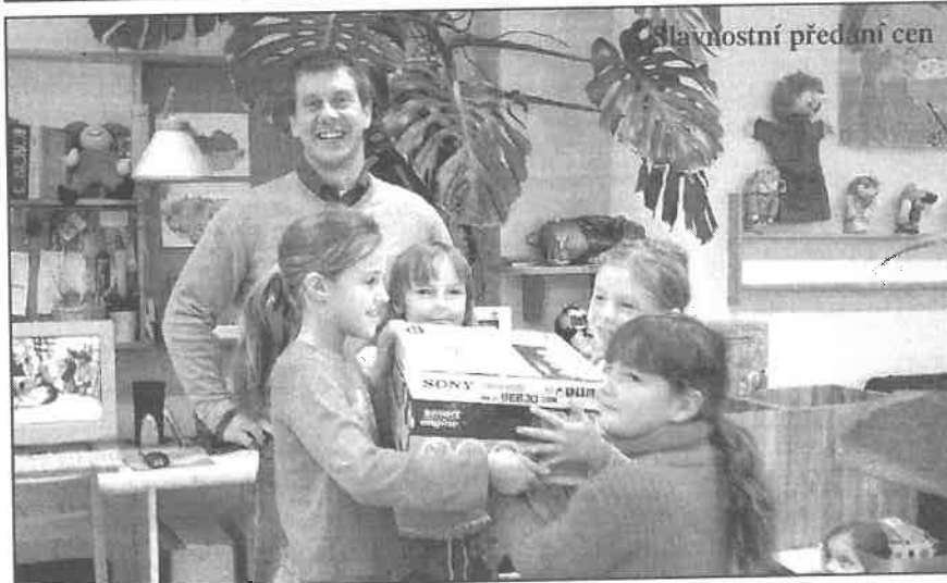
Slavnostní předání cen

SEL JSEM OD ÚKCHODU A POTKAL JSEM ZKRIVENÉHO PSA. PROTO JSEM SE SJHOVAL DO KLUBSTONA KTERÉ JSME SE UČILI VE ŠKOLNÍ DRUŽINĚ. PES MĚ OCICHAL A SEL PRYČ.