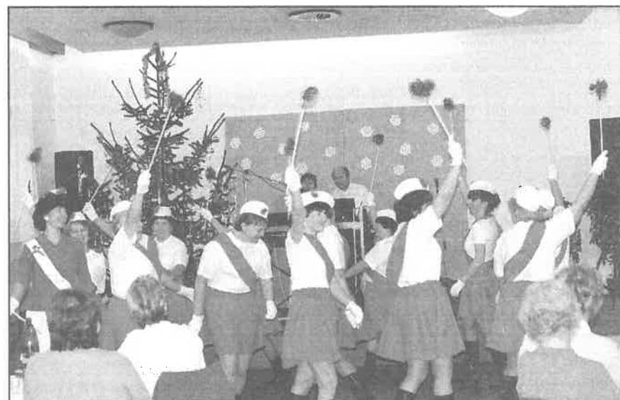
Mažoretky z Valašské Polanky při vystoupení.