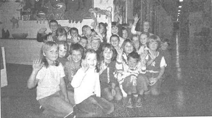
Naše děti a galerie psích plemen