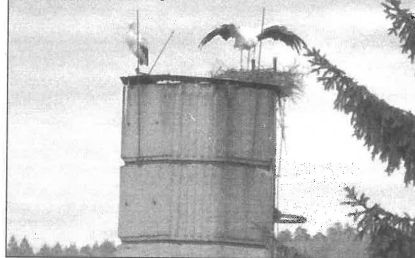
Čápi na komíně DDaSS v Liptále

Mnozí jste si všimli, že se u nás v obci začali objevovat čápi. A nejenom čáp bílý, ale i černý. Zde je několik odpovědí na Vaše dotazy. Párek čápů býlých si