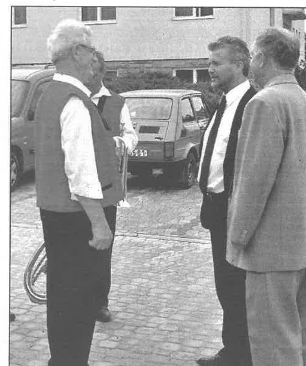
Hejtman zlínského kraje a starosta obce pozdravili členy lipotálské kapely.