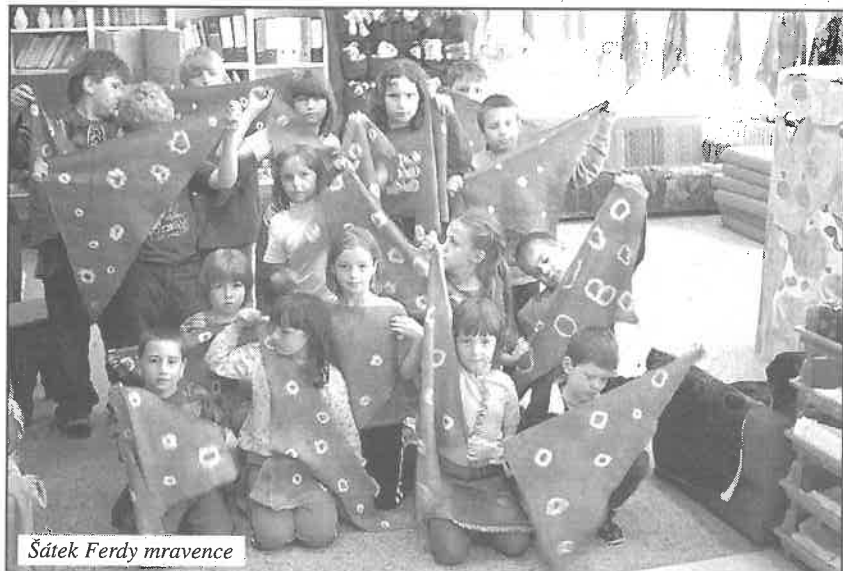
Šátek Ferdy mravence

znalosti a putovaly do Ferdova mraveniště přes deset tajných komůrek. Za úspěšné a pilné plnění úkolů získávaly body do celkového hodnocení. Mravenčí rada na závěr roku odměnila nejlepší mraveněčky diplomem a drobnými dárky.