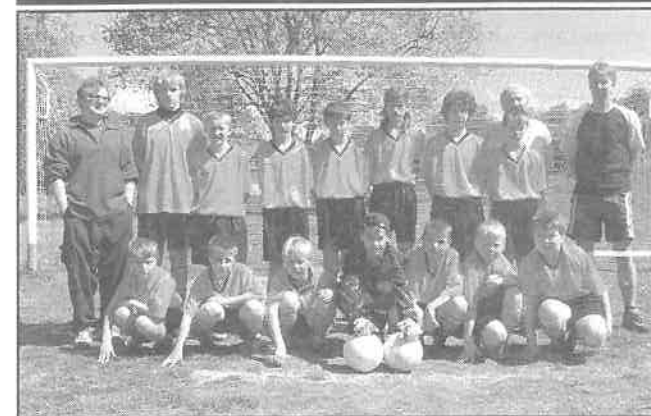
Fotbaloví žáci Liptálu na podzim bojovali. V posledním zápase dokázali remizovat s vedoucím týmem soutěže! Fotbalový klub (FK) Liptál