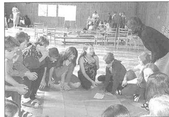
Projektový den - 7. třída.