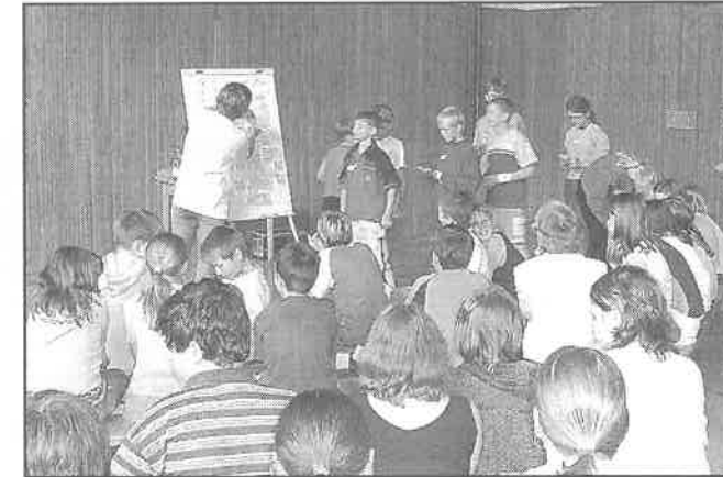
EVVO - projektový den.