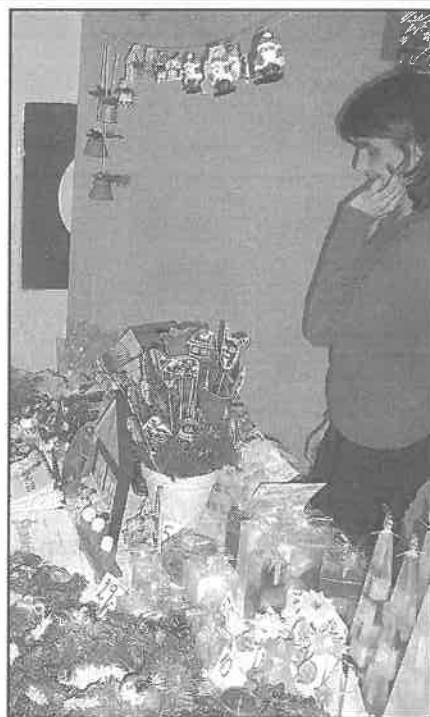
Prodejní stánek výrobků žáků.