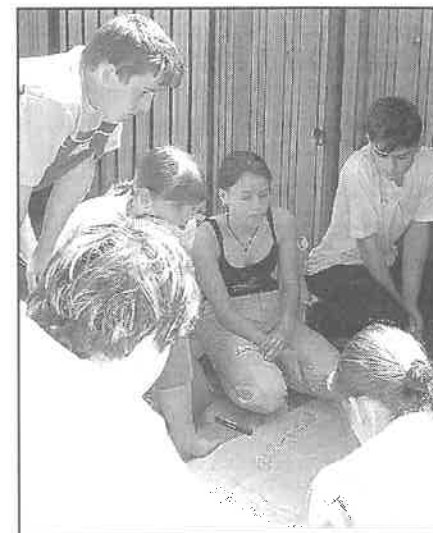
Projektový den - 8. třída.

Díky tomuto projektu si žáci prakticky vyzkoušeli nejen vyjádřit se kriticky ke svému okolí, ale také snažit se vlastními silami případné nedostatky odstranit. Pokud povedeme žáky tímto směrem, mohli by z nich vyrůst občané, kteří se o své okolí budou zajímat, budou přicházet k volbám a budou mít snahu aktivně pomáhat při řešení problémů. Věra Halová, ředitelka ZŠ