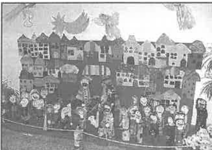
Betlém školní družiny.

Učitelé také potěšil zájem i slova uznání kolegů - učitelů z jiných škol.