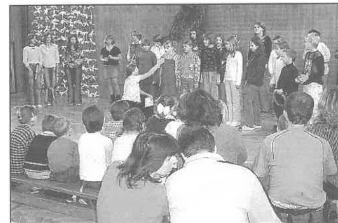
Zahájení vystoupení žáků.