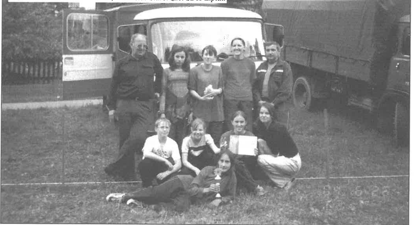
Francova Lhota - 26. 06. 2004, 3. místo: Starší žáci SDH Liptál.