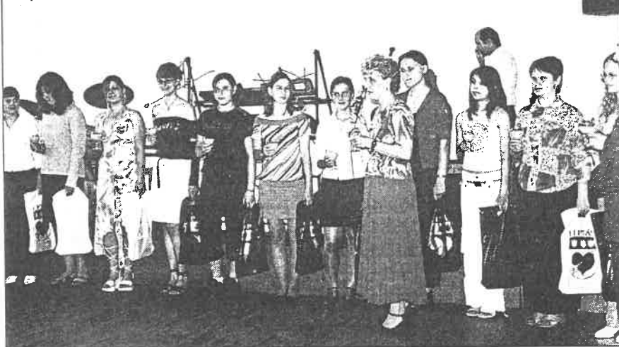
Připítek na rozloučenou.

At ti tvá cesta běží vsříc At ti vítr v zádech pomáhá At ti zář slunce hřeje líc A dešť at svaží pole tvá. Než se znovu setkáme At Bůh tě chrání v dlani své.