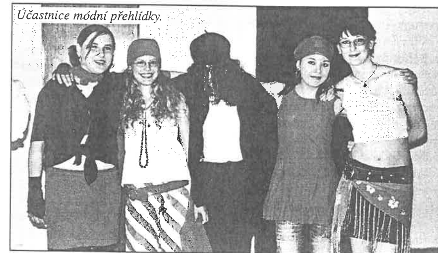
Účastnice módní přehlídky.