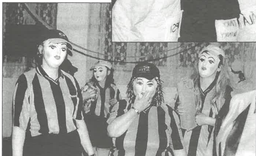
Absolutní vítězky – „Dívčí“ fotbalové „mužstvo“

Liptálský zpravodaj vydal Obecní úřad Liptál 6. 4. 2004. Odpovědný redaktor Miroslav Vaculík. Evidenční číslo MK ČR E 14494. Sazba: Mikeš Josef, Vsetín, tel.: 571 437 153. Tisk: TISK TG Lanškroun. Uzávěrka příštího čísla 25.06. 2004.