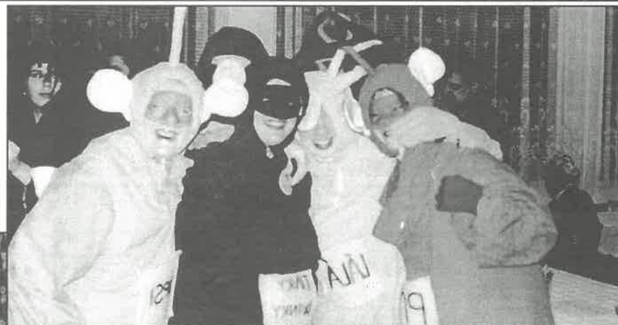
Na místě druhém – Teletubbies

Pořadatelé TJ Start Liptál – fotbalový klub se ještě dvěma fotografiemi vrací k letošnímu maškarnímu plesu 28. února 2004, který uzavřel „bálovou“ sezónu pro letošní rok. Dlužno poznamenat, že byl, co se týká masek, ještě úspěšnější než ten loňský! O tom ostatně svědčí tyto fotografie.