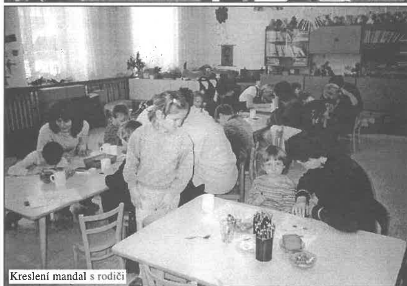
Kreslení mandal s rodiči