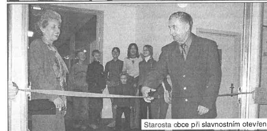
Starosta obce při slavnostním otevření