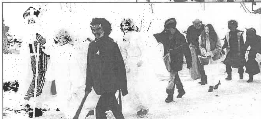
Mikuláš se totiž již teď těší na další rok.