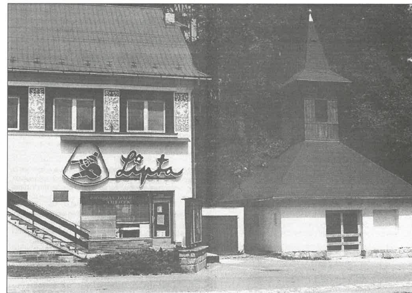
Na snímku vpravo zrekonstruovaná stará hasičská zbrojnice těsně před dokončením, vlevo budova ústředí VD Lipta, dříve zemědělský dům jehož 70. výročí od otevření si v těchto dnech připomínáme.