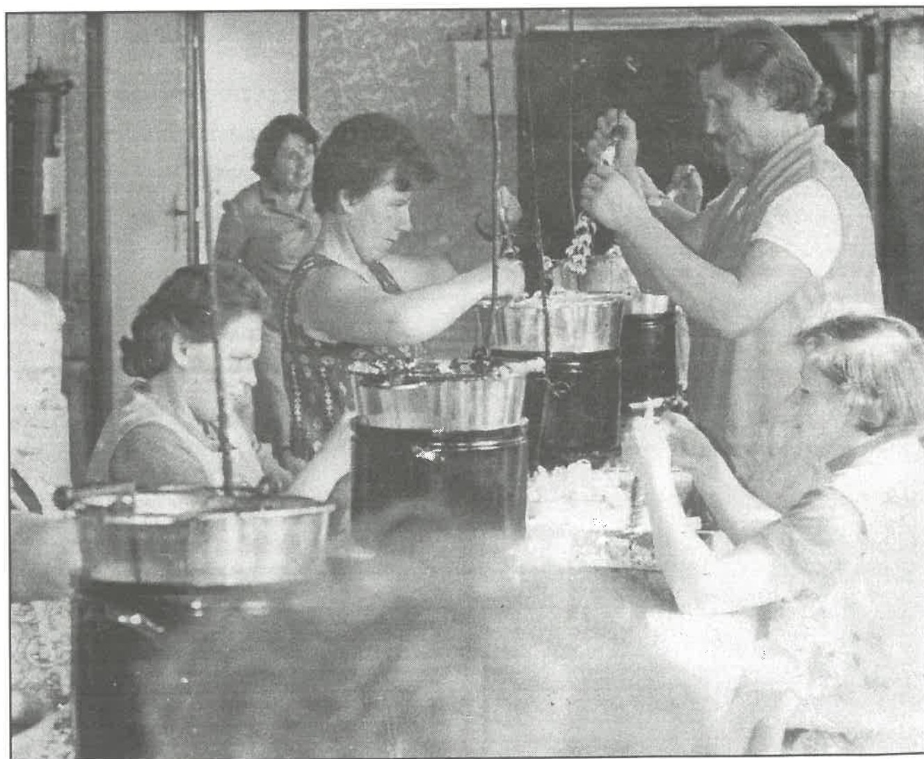
Výroba svíček v Zemědělském družstvu Liptál počátkem 70 let.