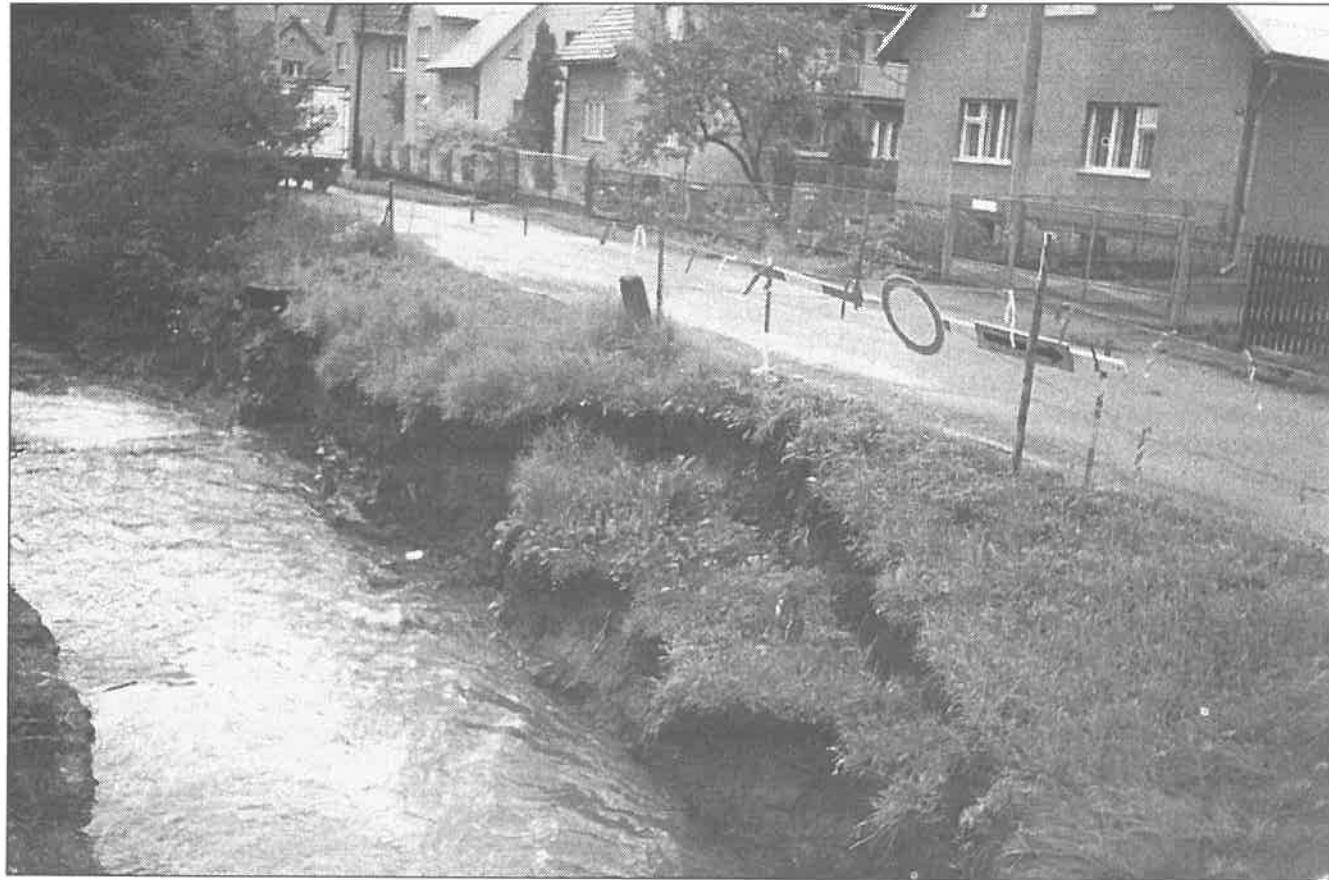
▲ Jedno z postižených míst naší obce při nedávné povodni. Zcela zničený splávek u hřbitova a poškozený břeh komunikace u čísla 16.