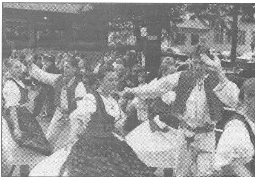
Jubilující soubor Lipta v průvodu.