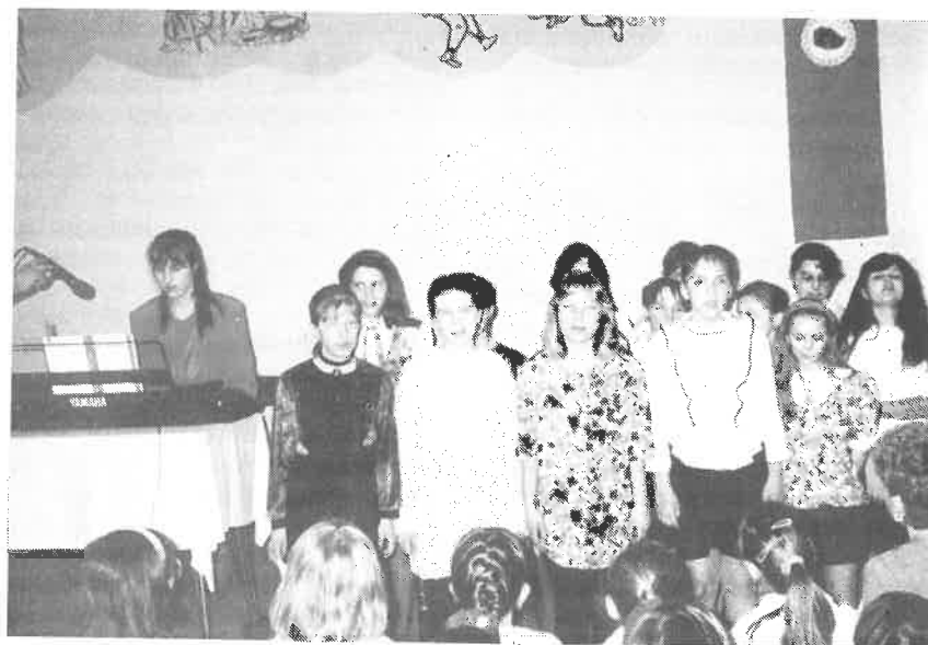
Sbor žáků - 6. 7. a 8. třída