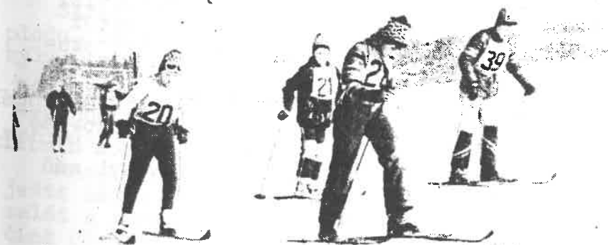
Lyžařských závodů o pohár Štěpána Kováře 1982