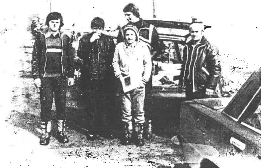
návrat ze soutěže z Oder 82

/LMK/. Členové klubu se zúčastňují i hospodářské činnosti ZO. Odpracovali při ní 1.120 brig. hodin. Na pracích pro vybavení klubovny a dílny odpracovali 160 hodin. Při výstavbě vysílacího střediska Bačková odpracovali 490 hodin.