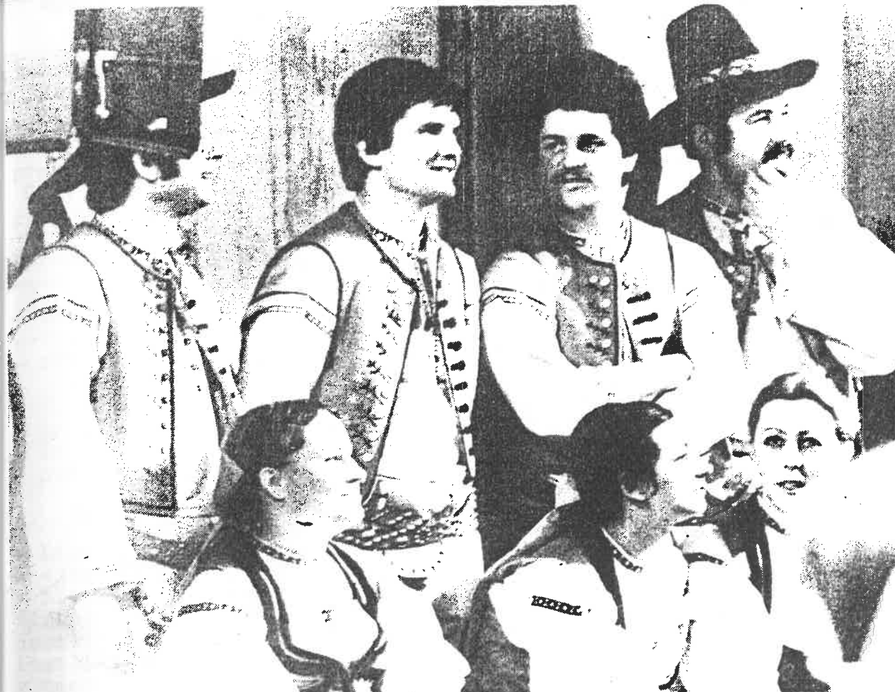
Členové souboru SV PT při natáčení v ostravské televizi dně 21.1.83