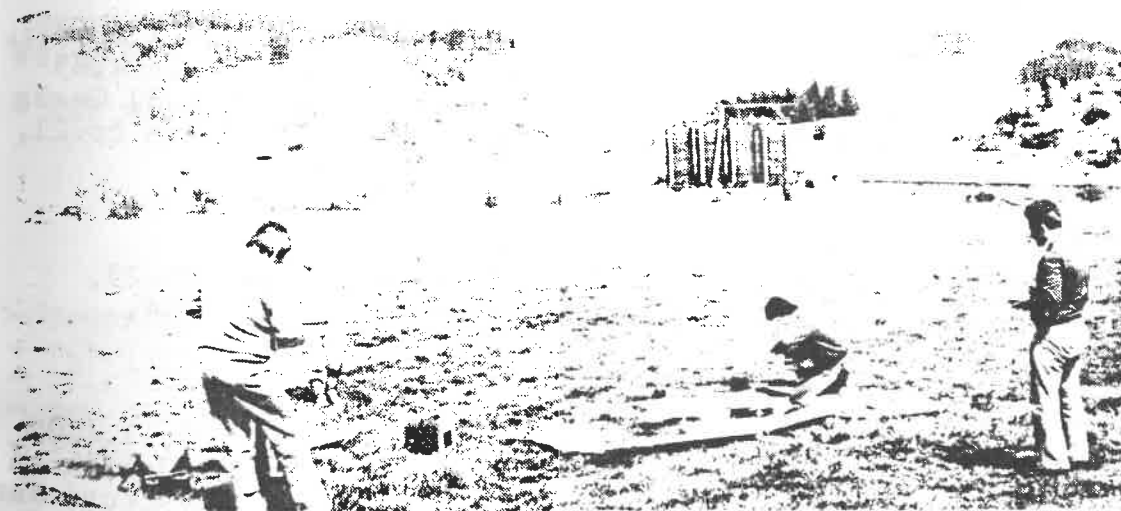
z tréninku na liptálských pasekách

v Liptále byl ustaven 13.1.1978. V letošním roce chtějí spolu s ostatními kluby ZO SVAZARMU uspořádat opět "Svazarmovský den" v Liptále, na kterém provedou předváděcí lety volných i radiem řízených modelů šesti kategorií, pro místní mládež bude uspořádána soutěž v kategoriích malých kluzáků "Vážka" a na volné ploše bude instalována výstavka modelů všech kategorií, které byly vyrobeny v tomto klubu včetně výstavky ovládacích aparatur a různých pomůcek pro leteckomodelářský sport.