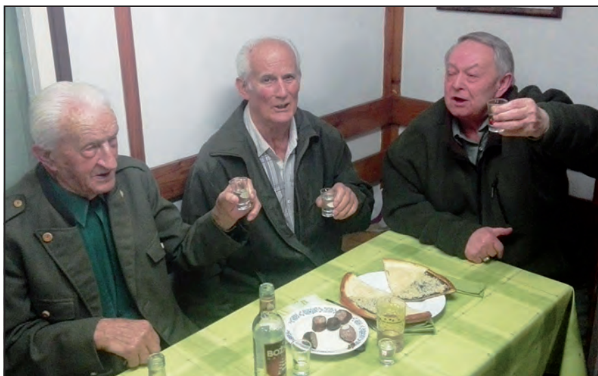
Na zdraví v novém roce všem přejí myslivci!

Myslivecký spolek Brdisko Liptál Vás srdečně zve na tradiční