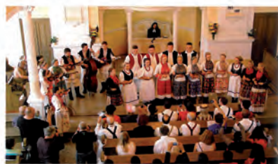
Převážně vystupující zahraničních kulturů v evangelickém kostele

a pro něho je sám Ježíš Kristus, podle jehož učení je každá politika má být společná. Liptál žije v harmonii zvlášť v tyto slavnostní dny. Není zakázáno při podobných lidových písních a podáních na kráse tance podlékaví gramoni života za pohybu, hudba a rádob, které nás od kontinenty se kontinenty spojuje. Za dobré věci, o které se máme ještě víc rozdělovat, aby naše písně odpovídaly ještě více realitě. Ať je to naše naděje. Amen.