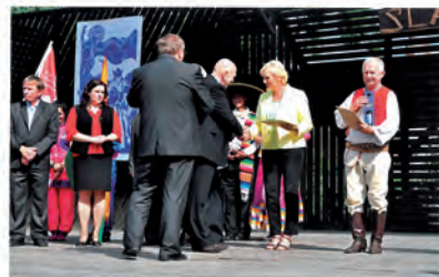
Na pódium po převzetí ocenění Ceny Evropské