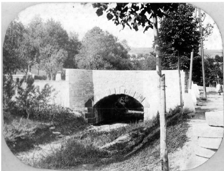
Most pod „Bránou“ v Liptále