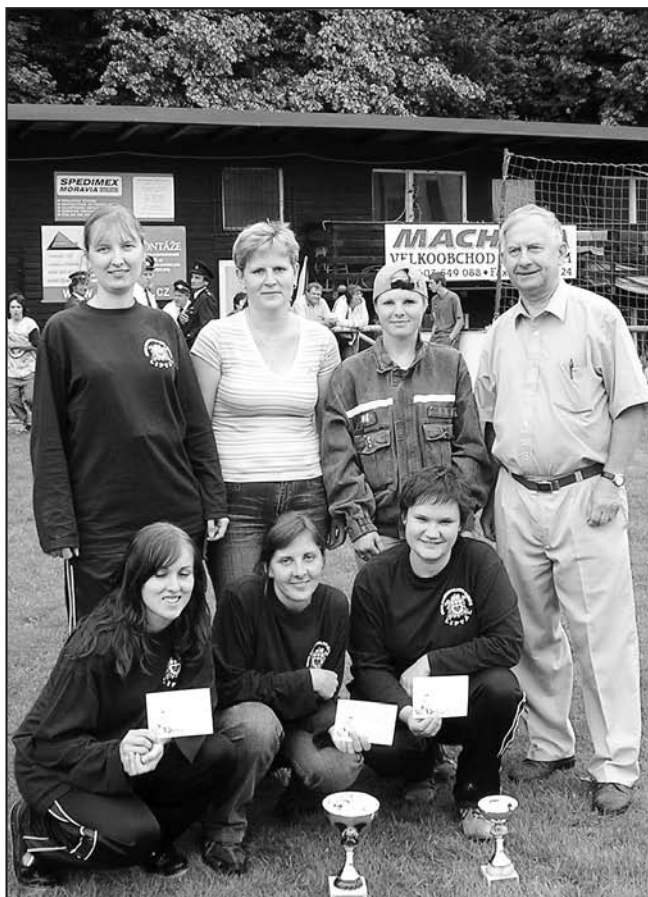
Liptálské družstvo žen se starostou obce.

Kateřince, 2. Liptál, 3. Jasenná, 4. Semetín.