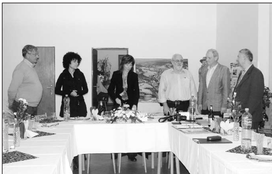
Krátké zhodnocení a rozloučení.