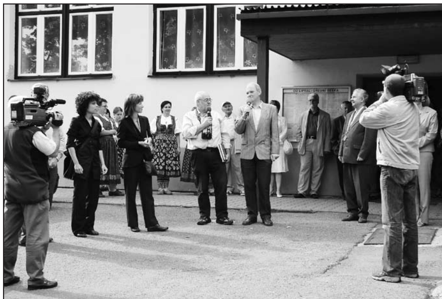
Přivítání členů komise.