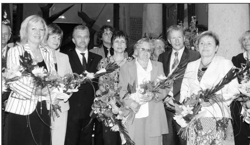
Společné foto s hejtmánem Zlínského kraje.