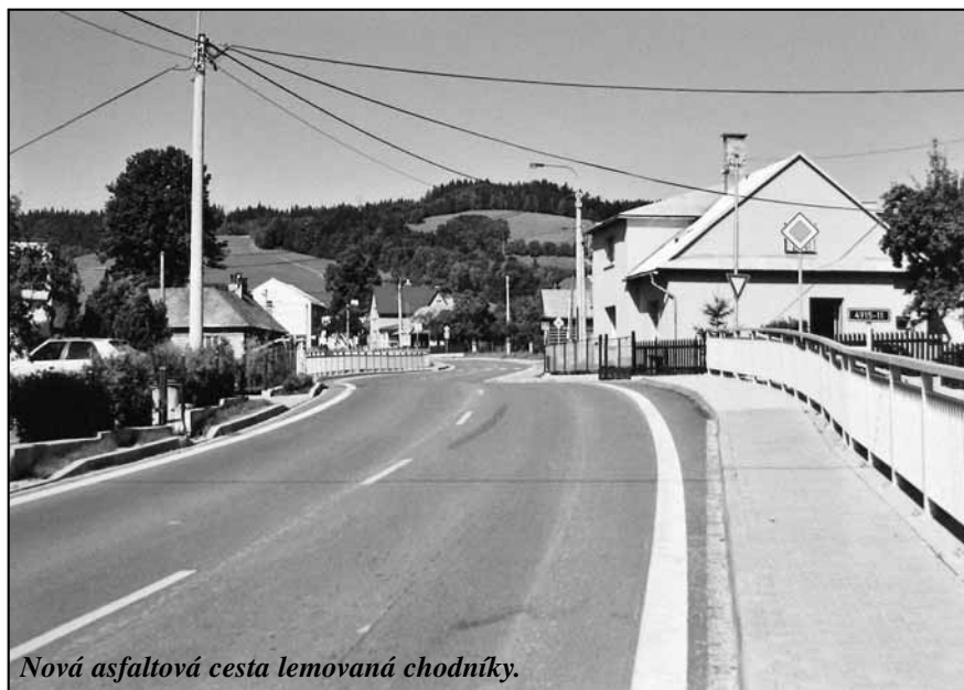
Nová asfaltová cesta lemovaná chodníky.

Za ten byl ostatně odměněn už v minulosti. V roce 1997 dostal v soutěži