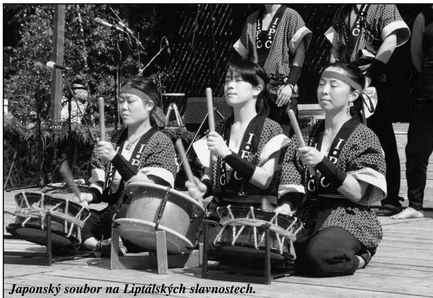
Japonský soubor na Liptálských slavnostech.

Jak Liptál využije milion korun, který dostane od pořadatelů soutěže, zatím