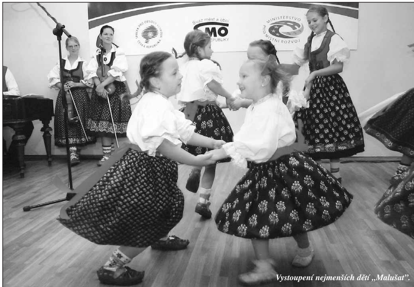
Vystoupení nejmenších dětí „Malušat“.