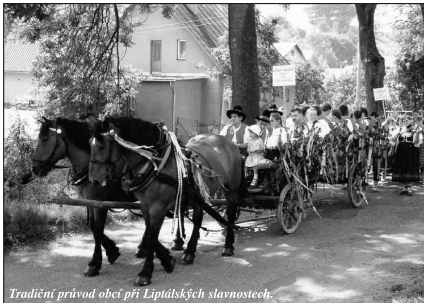
Tradiční průvod obcí při Liptálských slavnostech.