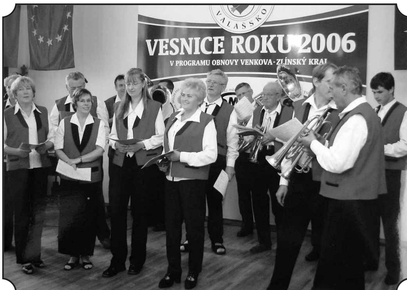
Místní dechová hudba Liptalanka při vyhlášení výsledků soutěže „Vesnice roku“ ve Zlínském kraji.