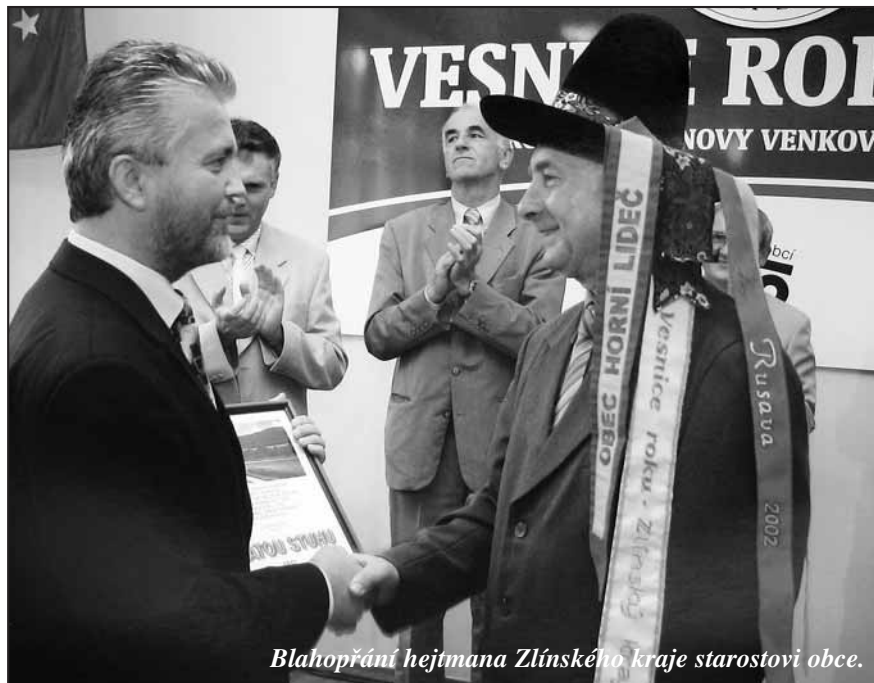
Blahopřání hejtmana Zlínského kraje starostovi obce.