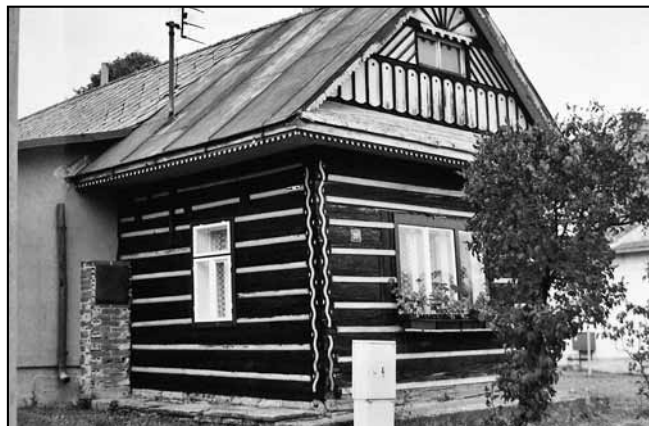
Turisté si rádi prohlédnou i zdejší roubenky.