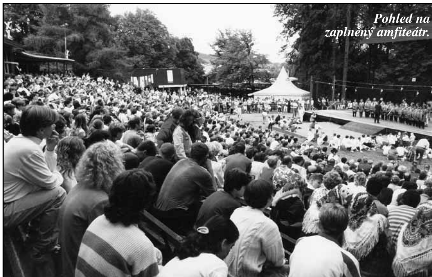
Pohled na zaplněný amfiteátr.

K netradičním liptálským svátkům patří i vzpomínka na mistra Jana Husa se symbolickým pálením hranice, která