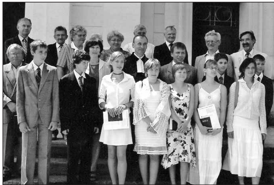
Konfirmandi a staršovstvo sboru Českobratrské evangelické církve v Liptále.