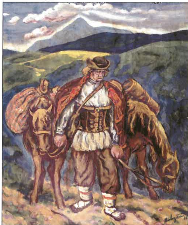
Hucul s koněm, 1946, olej na papíře (soukromý majetek)