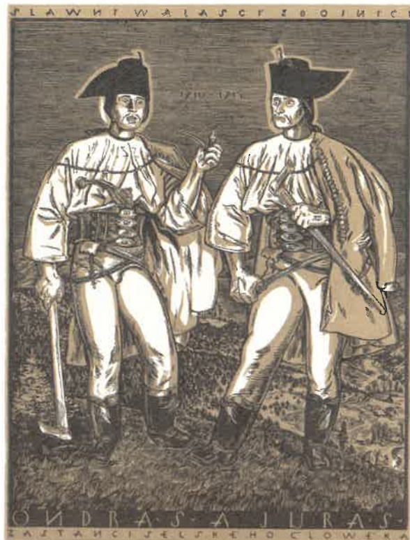
Ondráš a Juráš - zastánci selského člověka, nedat., barevný dřevoryt (1930)