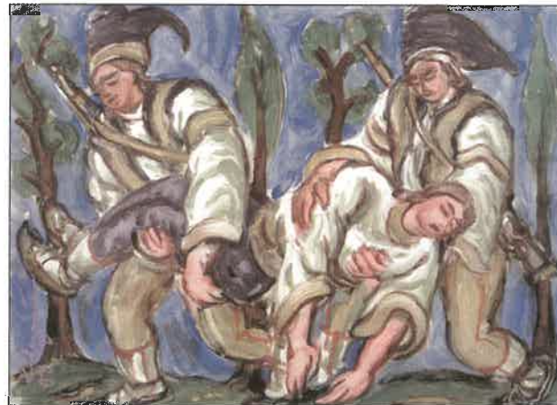
Raněný zbojník, 1950, tempera na lepence (majetek SG Zlín)