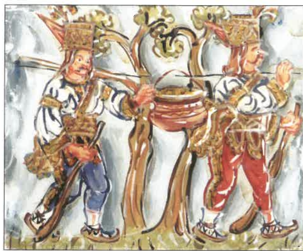
Zbojníci nesou v kotli zlaťáky, nedat., tempera a staniol na skle (kolem r. 1950)